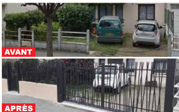
Portail, clôture de muret et portillon assorti pour ce modèle "Dune" de chez CADIOU. Modernité, lignes épurées, design inspiré du monde végétal !