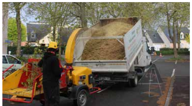
Broyage et mise en copeaux