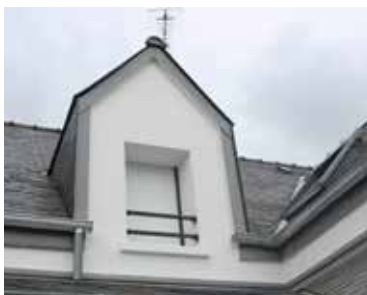
Fenêtres et garde-corps

Oui car disposer d'un interlocuteur unique jusqu'à la réception des travaux, est un avantage que nous mesurons aujourd'hui considérable voir indispensable, surtout en rénovation où la coordination des différents intervenants peut rapidement devenir un vrai casse tête quand on est pas du métier. D'autre part, l'expérience d'avoir acheter nos matériaux chez un professionnel qui en assume aussi la pose, comme le font Les Matériaux de l'Ouest, est une preuve d'engagement vers « la satisfaction client » que nous avons fortement apprécié !