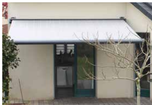
A Noyal Châtillon, toiles de qualité et lumière diffuse !