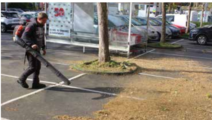
Nettoyage par soufflage

Si ces prestations nécessitent des qualités physiques importantes, il est remarquable de constater à quel point For' Est Exploitation parvient à les mettre en œuvre avec calme tout en en faisant l'effort de rester disponible aux questions et besoins de leurs clients. Ouverte aux petits comme aux plus grands travaux, vous avez là, une entreprise de référence !