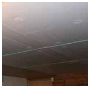
Isolation du plafond de sous-sol