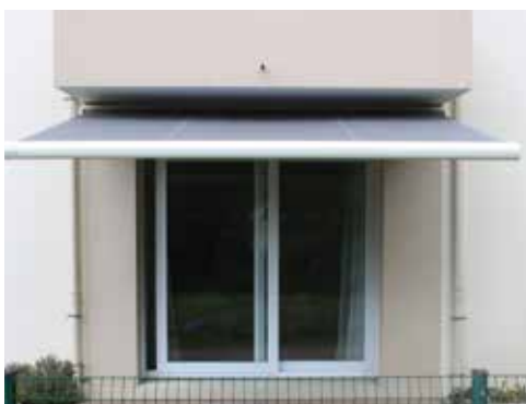
A Vern sur Seiche, du vrai sur-mesure !

Hall d'exposition de 60m 2 ouvert du mercredi au vendredi de 9h à 12h et de 14h à 18h, le samedi sur demande