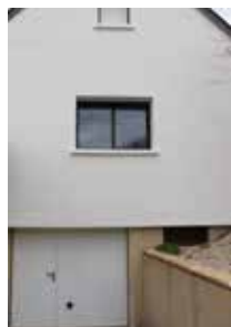
Porte de garage et fenêtres