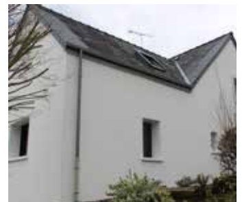
Isolation Thermique par l'Extérieur