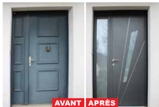
Ancienne porte d'entrée bois, remplacée par un modèle aluminium de grande qualité alliant esthétique, sécurité et isolation !