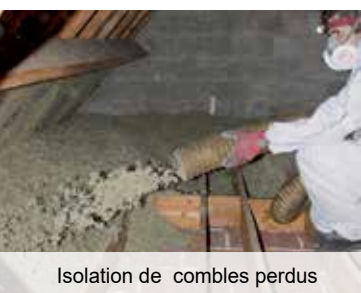
Isolation de combles perdus