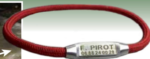
Couleur: Noir ou rouge

CANITEC - Pincerotte Campel 35330 Val d'Anast - Tél.: 06 88 24 00 28 - Email : canitec35@gmail.com