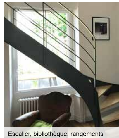
Escalier, bibliothèque, rangements