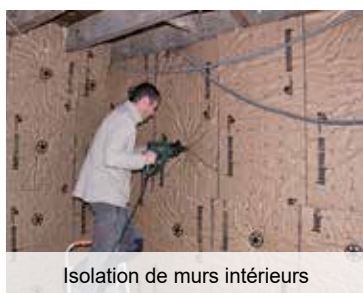
Isolation de murs intérieurs