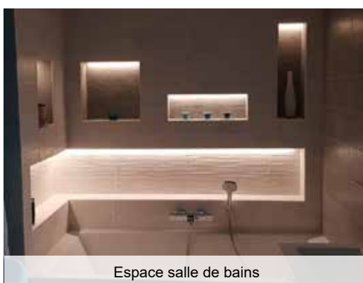
Espace salle de bains