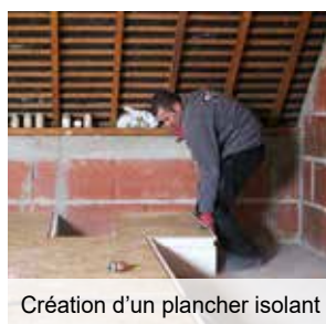
Création d'un plancher isolant