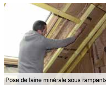
Pose de laine minérale sous rampants