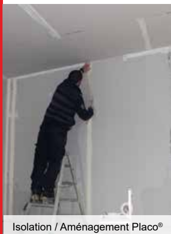
Isolation / Aménagement Placo®

Labellisée Qualibat RGE et Eco artisan, « Perrin Christophe Menuiserie » cultive un partenariat de longue date, avec des fournisseurs renommés tels que K-Line ; Janneau Menuiserie ; Sopac ; Bouvet ; Pasquet ( Val d'Izé ), etc, une dynamique qui lui permet de proposer des produits à la pointe de l'innovation avec notamment des solutions bois dont les produits de protection permettent une meilleure longévité, des menuiseries monocolores et bicolores, mixtes ou à matériau unique, sans oublier la domotique qui vous permettra de gérer plus simplement votre quotidien et de rester connecté à votre maison !