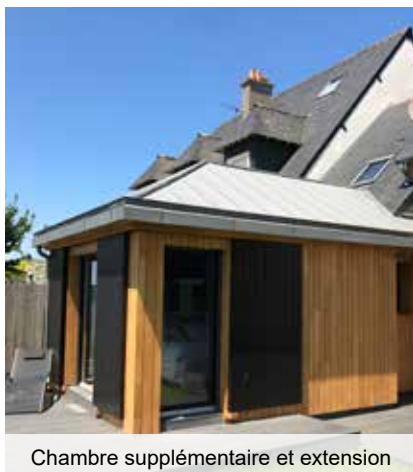
Chambre supplémentaire et extension