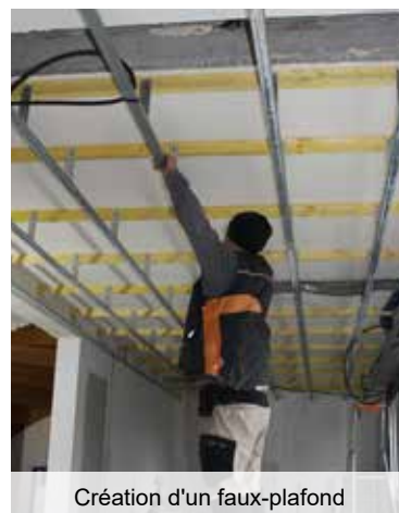
Création d'un faux-plafond